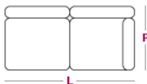
Elemento 2 posti L 150 cmcm x P 95 cmcm