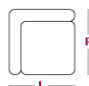
Elemento angolo retto L 110cm x P 110cm