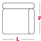
Elemento 1 posto L 87cm x P 95cm