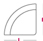
Elemento angolo tondo L 110cm x P 110cm