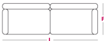
Divano letto: divano 3 posti L 230cm x P 93cm

* Le dimensioni si riferiscono ai modelli con bracciolo tondo da 18 cm.