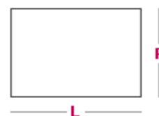
Elemento tavolino L 105cm x P 50cm