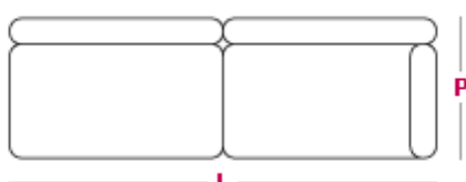
Elemento 3 posti L 190cm x P 105cm