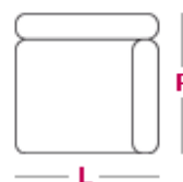
Elemento 1 posto L 90cm x P 105cm