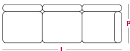
Elemento 3 posti maxi L 210cm x P 105cm