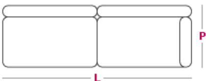
Elemento 3 posti L 180cm x P 100cm