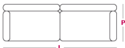
Divano 3 posti maxi L 220cm x P 100cm