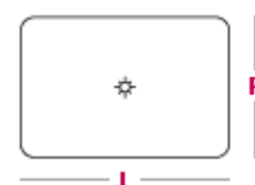
Pouf rettangolare L 90cm x P 55cm