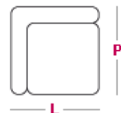
Elemento angolo L 100cm x P 100cm